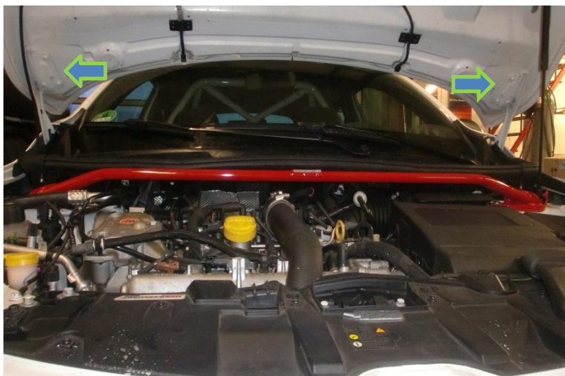
Schrauben an den Scharnieren